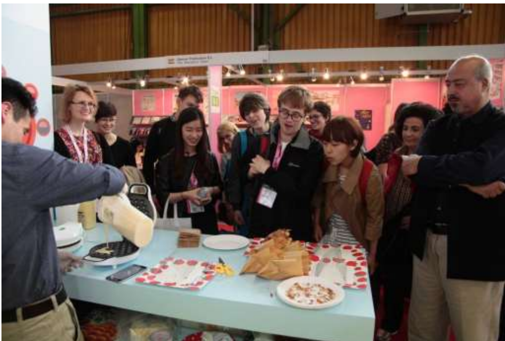
「香港館」今年在 2016 博洛尼亞兒童書展舉行文化交流活動—「港式雞蛋仔試食」，深受現場參觀者歡迎。